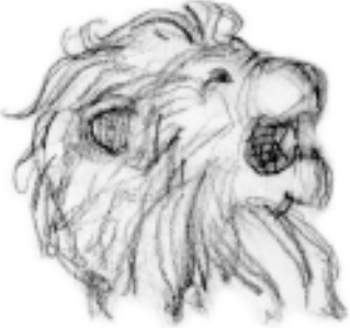
Ilustração da Escada

Deus sabe exatamente o que estou sentindo, emocionalmente, o que estou passando, e isto O comove profundamente.